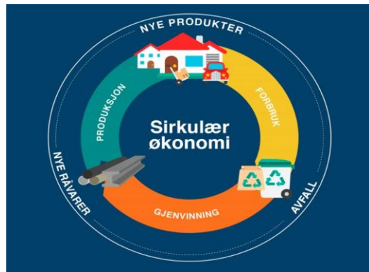
Figur 1 Sirkulær økonomi.

HRA skal sammen med regionens innbygger være best på sirkulering av ressurser.